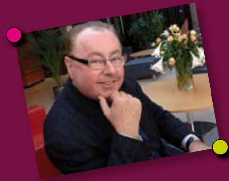
Dominique Dupilet Président du Département - Membre honoraire du Parlement

En 2009, malgré un contexte économique difficile, ce sont plus de 8 000 entreprises qui se sont créées dans le Pas-de-Calais ! Un véritable engouement pour la création-reprise d'entreprise puisque son nombre a quasi doublé par rapport à 2008, généré notamment par le statut d'auto-entrepreneur.