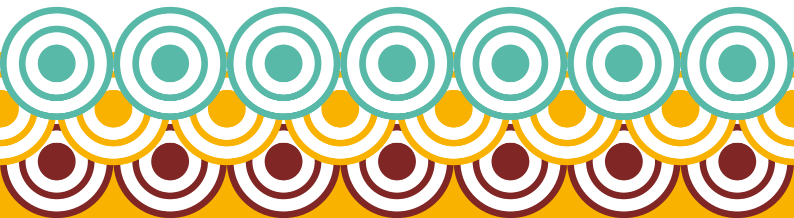
Schéma 2011-2015 départemental de l'enfance et de la famille