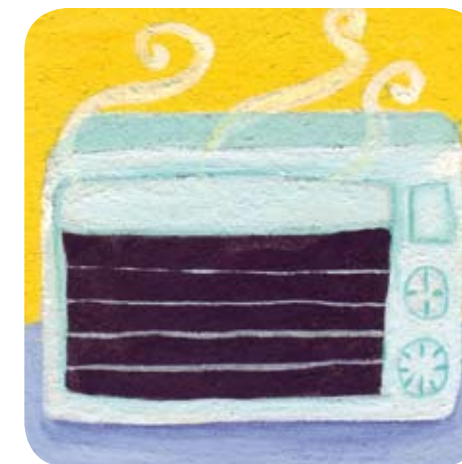
4 - La maman de Bijou met la papillote au four 30 minutes à 180°C (thermostat 6), puis elle mixe les légumes et coupe la viande en morceaux.