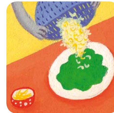
3 - Bijou mélange les pâtes, le gruyère râpé et les épinards.