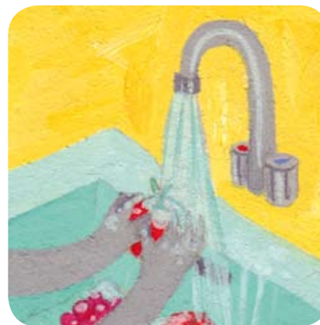
1 - Bijou lave les fruits, sa maman les coupe en morceaux.

Le truc de Bijou : Parsème ta mousse de vermicelles de chocolat multicolore.