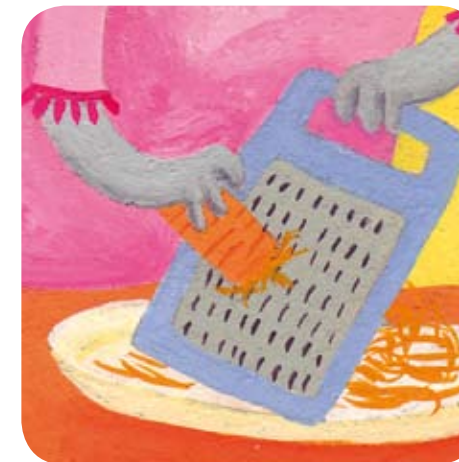
2 - Bijou demande à maman de râper la carotte dans un saladier.