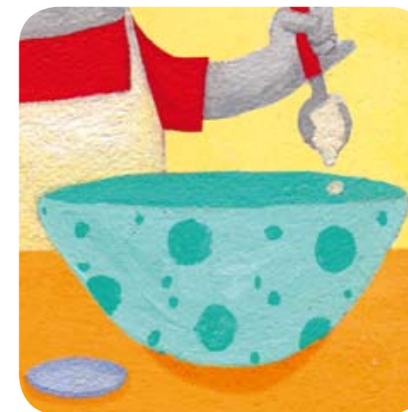
2 - Il les met dans un saladier avec le fromage blanc et le jus d'orange.