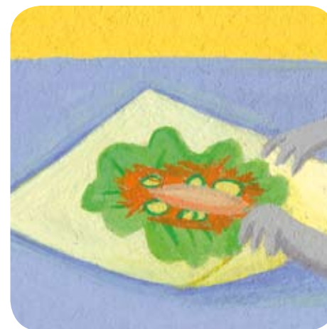
3 - Bijou dispose sur une feuille de papier sulfurisé les feuilles de salade, le blanc de poulet, la carotte râpée et les rondelles de courgettes. Il referme la feuille en papillote.