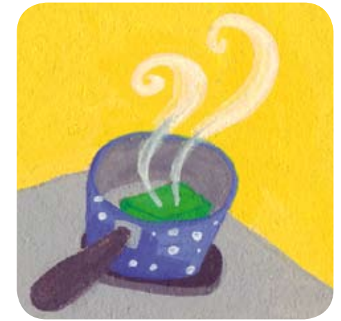
2 - Elle décongèle le galet d'épinards et le réchauffe dans une petite casserole.