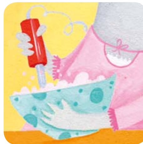
3 - Sa maman mixe le tout.