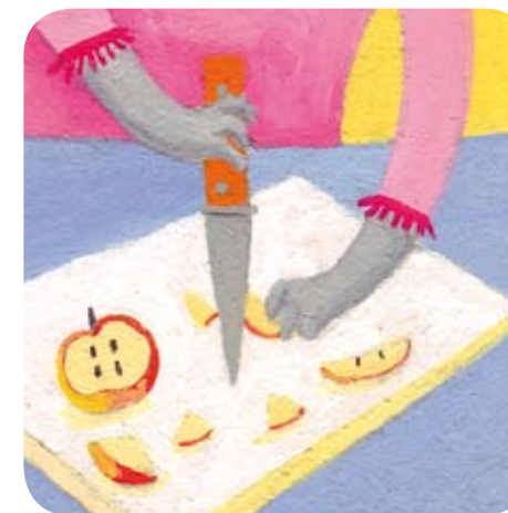
2 - La maman de Bijou épluche et coupe les fruits en morceaux.