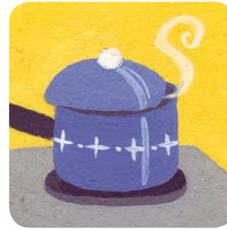
1 - La maman de Bijou fait cuire les pâtes dans l'eau bouillante et les égoutte.