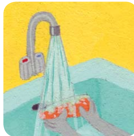
1 - Bijou nettoie une carotte avec maman après l'avoir épluchée.

Le truc de Bijou : Ajoute du persil pour décorer tes carottes râpées.