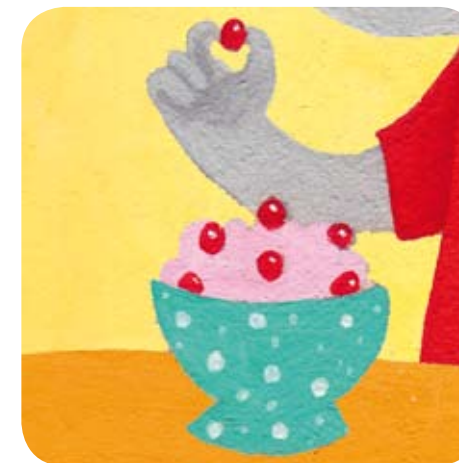
4- Bijou décore sa mousse avec des morceaux de fruits.