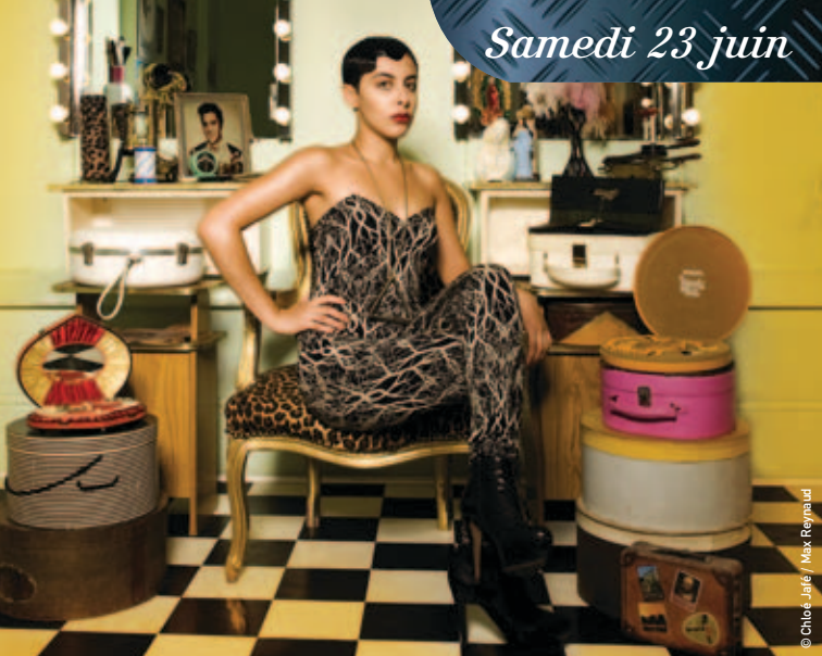
© Chloé Jafé / Max Reynaud